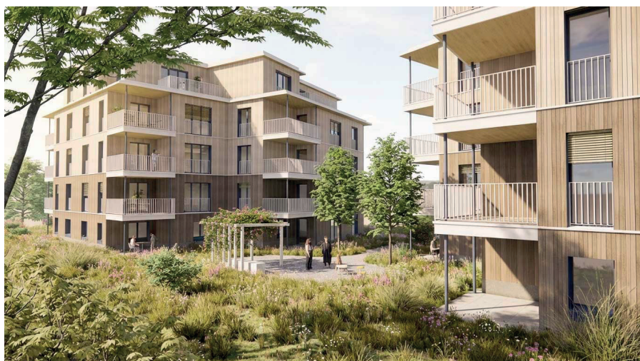
Zürich Altstetten: la construction de remplacement, qui répond à la volonté de mieux tirer parti de la surface disponible, permettra de passer de 18 appartements à 40.

pendant la durée des travaux. Les immeubles du lotissement de Blankweg, à Ostermundigen, feront l'objet d'une rénovation complète en trois étapes, et plus de 40% des locataires actuels conserveront leur logement à l'issue des travaux.